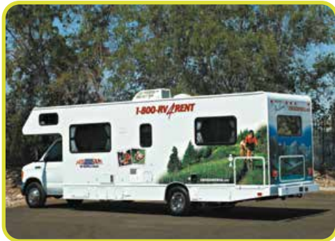
C30 Large Motorhome 9.1 Meters Long