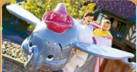
Dumbo the Flying Elephant