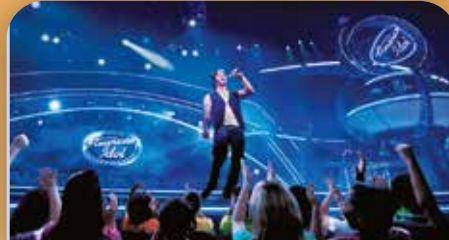
The American Idol Experience*

Découvrez ici le pouvoir de l'imagination et les merveilles de l'univers. Un voyage autour du monde, explorez les cultures de 11 pays en un seul jour dans le "World Showcase" ou mettez pleins gaz dans le "TestTrack", le test de conduite de votre vie ! Survolez les magnifiques paysages au cours d'un stupéfiant voyage dans le "Soarin'". Ne manquez surtout pas de voir IllumiNations : Reflections of Earth, un spectacle son et lumière avec feux d'artifice.