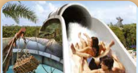
Crush 'n' Gusher at Disney's Typhoon Lagoon Water Park

Les aventuriers se retrouvent face à face avec des lions, des éléphants et des crocodiles dans le Kilimanjaro Safaris et vous émerveillerez devant des monstres préhistoriques dans l'attraction DINOSAUR. Préparez-vous à faire une rencontre inoubliable avec le Yeti sur le spectaculaire grand huit d' "Expedition Everest". Assistez au grand spectacle "Finding Nemo-The Musical" (© Disney/Pixar). Ensuite profitez de la fameuse comédie musicale "Festival of the Lion King".