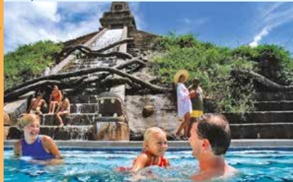
Disney's Coronado Springs Resort