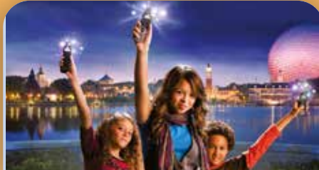
Disney's Kim Possible World Showcase Adventure

Entrez dans un monde magique où plus de 40 attractions vous attendent en sept pays imaginés. Où les éléphants peuvent voler et les tasses de thé dansent. Embarquez au bord du "Thunder Mountain Railroad" et participez à un pillage avec "Le Capitaine Jack Sparrow", son rival "Barbossa" et le fantomatique "Davy Jones" apportant un caractère nouveau à l'une des aventures les plus appréciées de tous les temps dans l'attraction Pirates of the Caribbean.