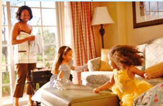
Disney's Saratoga Springs Resort & Spa