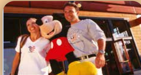
Guests at Downtown Disney Marketplace

Prix : 78 euro (ad)/ 31 euro (enf 3-9a.)