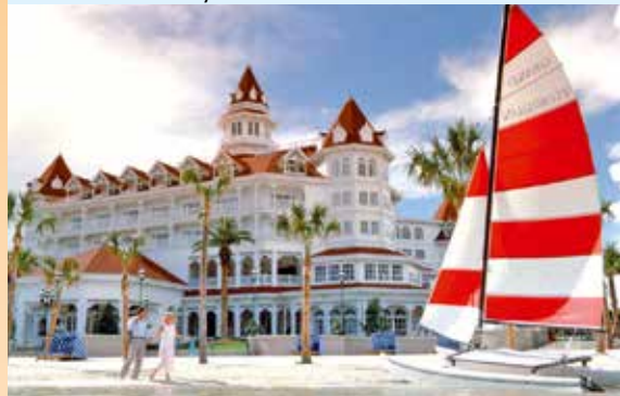
Disney's Grand Floridian Resort & Spa