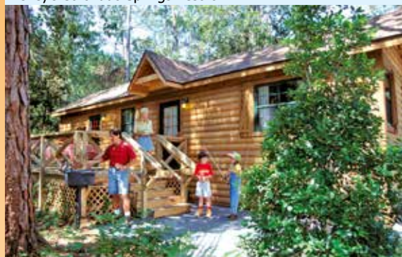
The Cabins at Disney's Fort Wilderness Resort