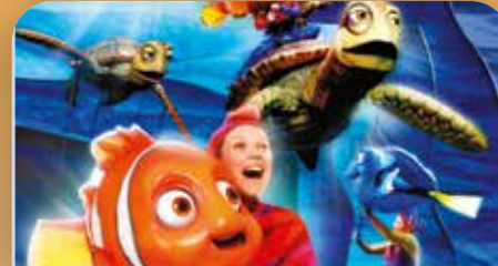
Finding Nemo—The Musical

Le show-business est mis à l'honneur aux "Disney's Hollywood Studios". Découvrez la nouvelle attraction "Toy Story Mania". À bord de votre véhicule et équipé de lunettes 3-D venez vous mesurer à toute vitesse aux personnages inspirés du film Toy Story (Disney/Pixar's). Assistez au spectacle "Lights, Motors, Action" ! Extreme Stunt Show qui vous révélera les secrets des meilleurs cascadeurs. Et participez dans "American Idol Experience" vous vous croirez dans l'émission.